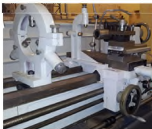
Люнеты и суппорт